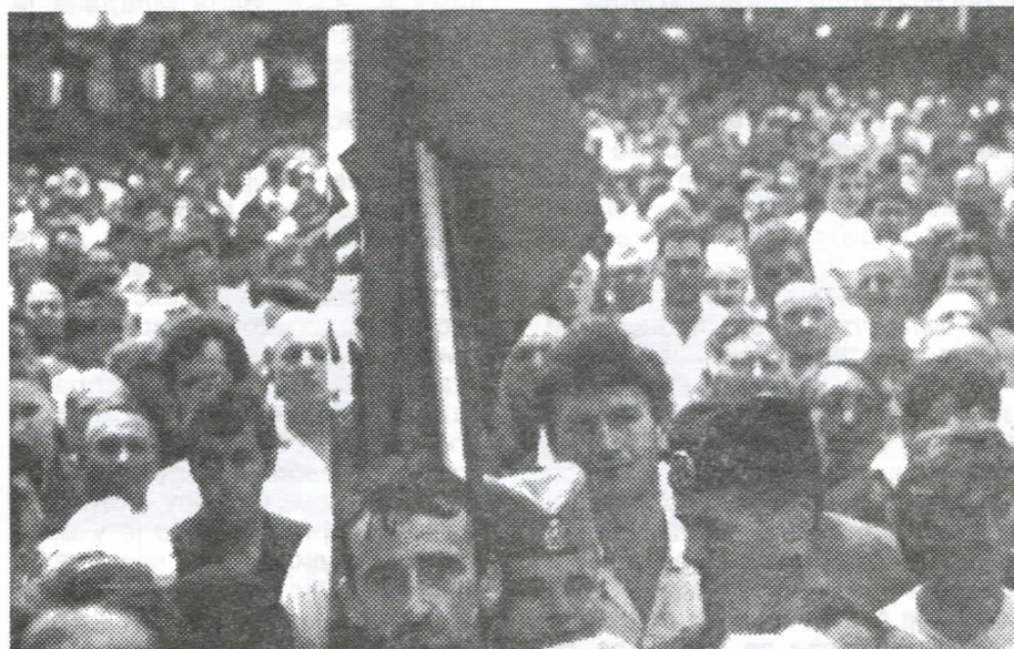
Са митинга у Лесковцу

Нисам преко ноћи постао председник Окружног одбора српских радикала. Деведесет треће сам постао председник једног од четири месна одбора странке у Лесковцу због изузетних заслуга и резултата у раду, маја 1993. године. После избора за подпредседника, у јануару 1994. године бивам огромном већином биран за председника Општинског одбора, а 12. децембра 1995. године на предлог председника Српске радикалне странке и Централне отаџбинске управе постављен сам на место председника Окружног одбора српских радикала и на