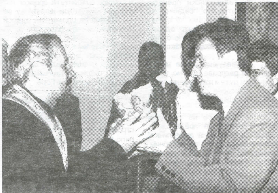
Са славе Свеиша љри Јерарха

2. Српска радикална странка, Српски покрет обнове, Демократска странка и Демократска странка Србије свечано