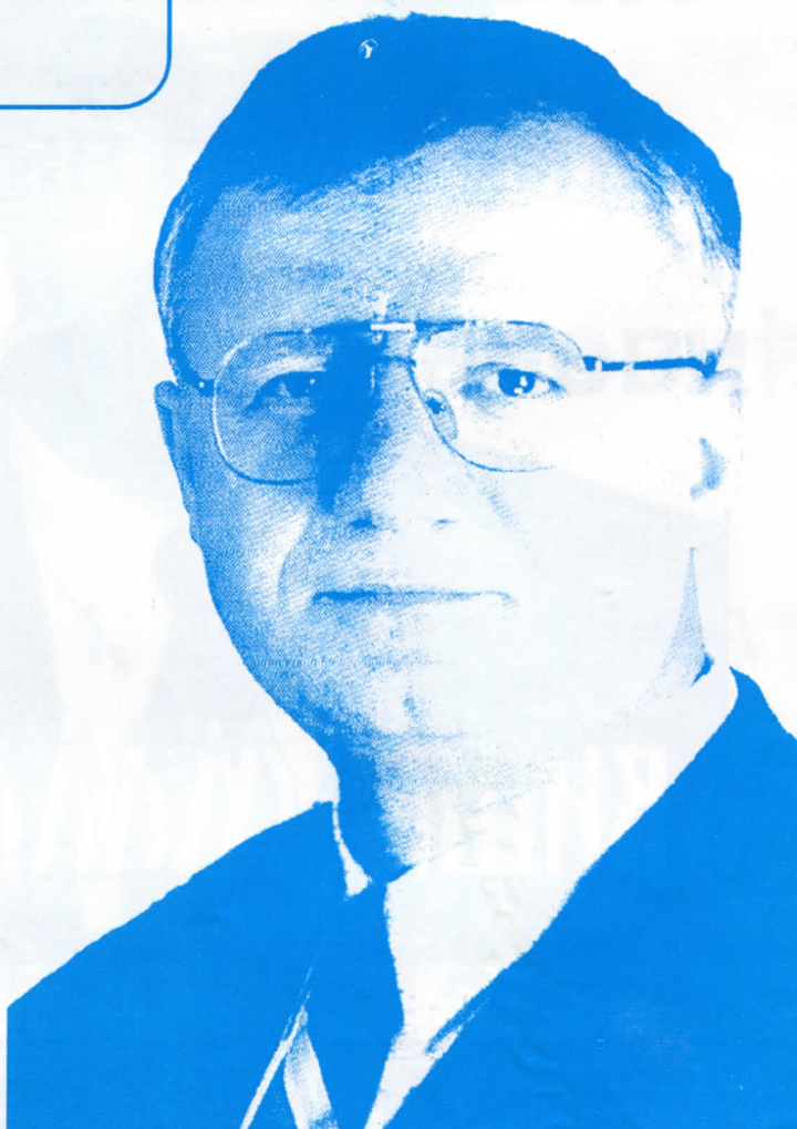
Др Војислав Шешелъ