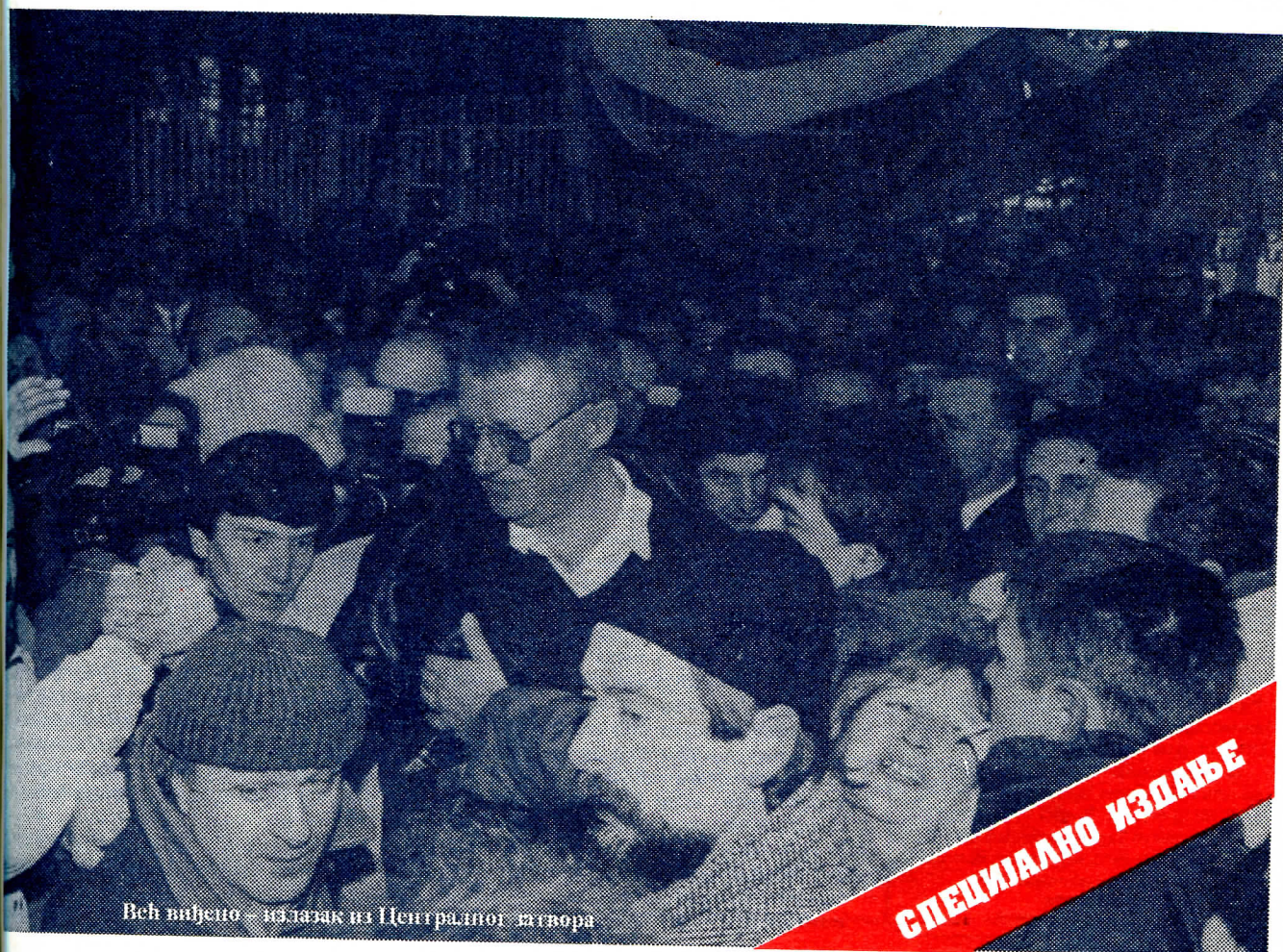
Већ виђено - излазак из Централног затвора