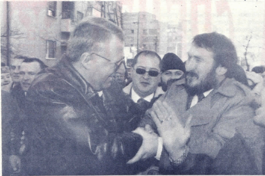
Београд, 28. јануар – излазак Војислава Шешеља из Централног затвора