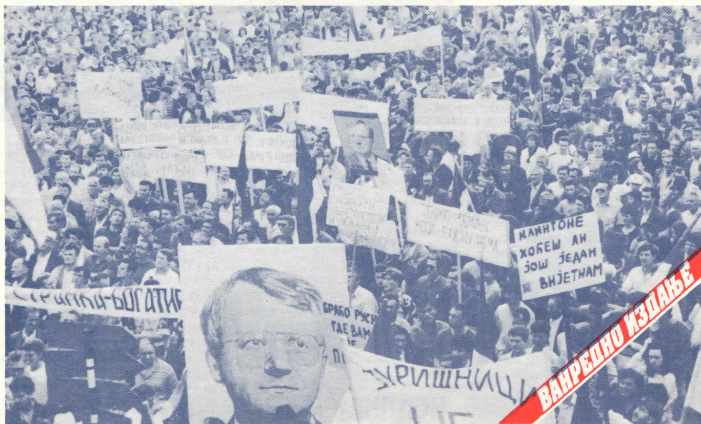
Лозница, мај 1993. год. – Митинг "Дрина није граница"

Дођите да заједно кажемо "Доста", преварама, пљачкама и уценама, да кажемо "Не" издајству, дођите да покажемо да у нашим грудима још увек бије српско срце и да нас никакве границе, ма ко их правлио неће поделити.